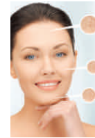
SEHR TROCKENE HAUT

4 Morgens und abends Juka d'Or® Lifting Balm auf Gesicht, Augen, Hals & Dekolleté auftragen und einmassieren.